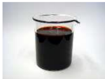
アスタキサンチン乳剤1%