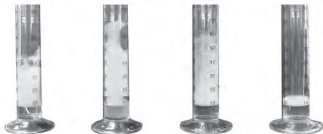
※2分後の泡の状態(各試料：5倍希釈)