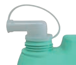
詰替え用キャップ