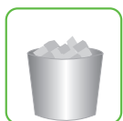
●汚水タンク・ダストボックス等