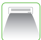
●クーラー・空気清浄機等

臭いの程度に合わせて、イレーサーTを原液～100倍位に水で希釈し、対象物にスプレーするか、希釈液で拭き取ります。