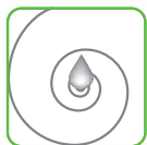
●し尿処理場・ゴミ処理場等