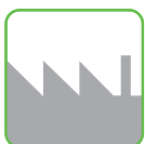
●水産・食品工場等