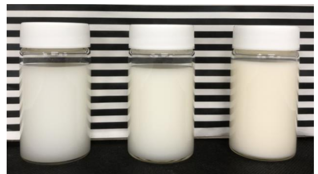
50mg 100mg 200mg 水100mL中のDHA量