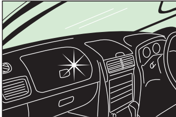
▼自動車室内(プラスチック部分)