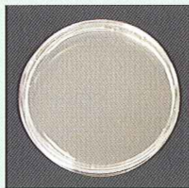
アルミフィン洗浄後